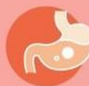
Проблемы с ЖКТ у детей